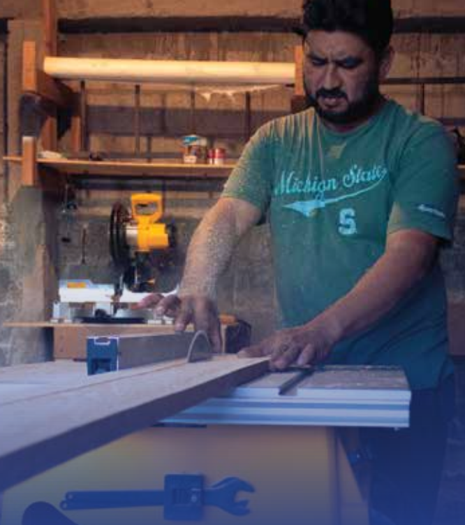
OIM 2021 © Alejandro Cartagena

La demanda de productos libres de explotación, trabajo infantil o cualquier otra práctica de esclavitud moderna ha aumentado la presión sobre las empresas para mejorar sus procesos y debida diligencia. Ante esta situación, necesitan ser proactivas para proteger su reputación, evitar multas gubernamentales y costos legales, cumplir con sus obligaciones y regulaciones laborales.